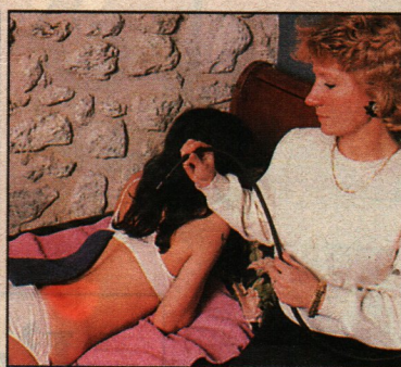
Comme on guérit par infrarouge ou ultraviolet.